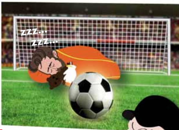
Morgan De Sanctis